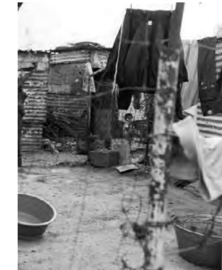
Dans un township sud-africain.

Les problèmes de logement constituent la première cause de mécontentement -c'est une rumeur selon laquelle des étrangers vivaient dans de nouvelles maisons sociales construites par le gouvernement, qui a déclenché les premières attaques à Alexandra. "De 2000 à 2004-2005 (...), le prix des maisons a augmenté de 92 %, tandis que le revenu des travailleurs augmentait de 8,3 % en moyenne", indique Le Monde diplomatique 6 qui cite l'exemple d'un homme du Cap âgé de 83 ans, placé sur liste d'attente depuis 20 ans pour obtenir un logement social. "Les gens veulent un toit, de