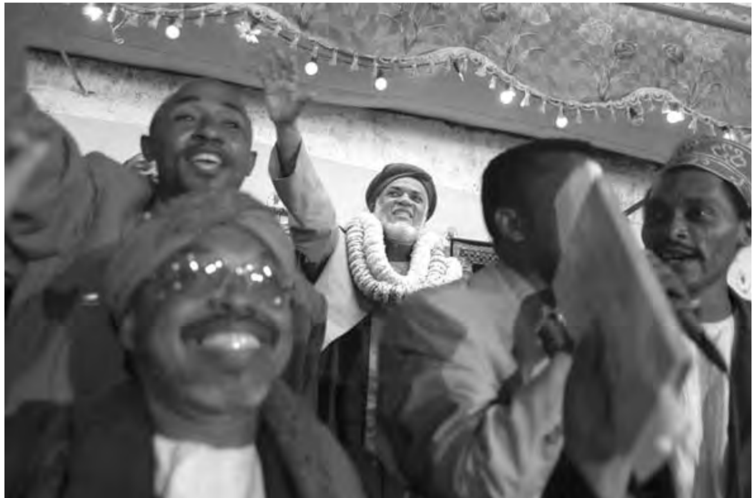
Au centre, Ahmed Abdallah Sambi, lors de la campagne électorale de 2006, à Mutsamudu.