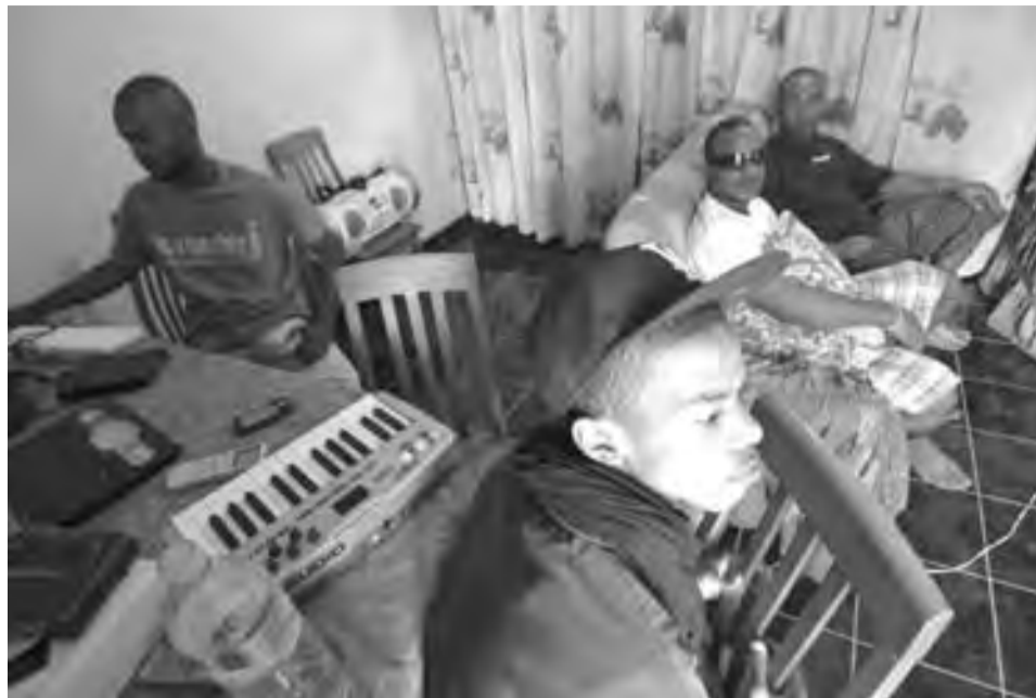
Ci-dessus, les membres de Masiwan Vibes dans leur studio de Doujani. Page de gauche, des dance-breakers de Mamoudzou.

"Ils ont vendu nos terres pour des projets immobiliers