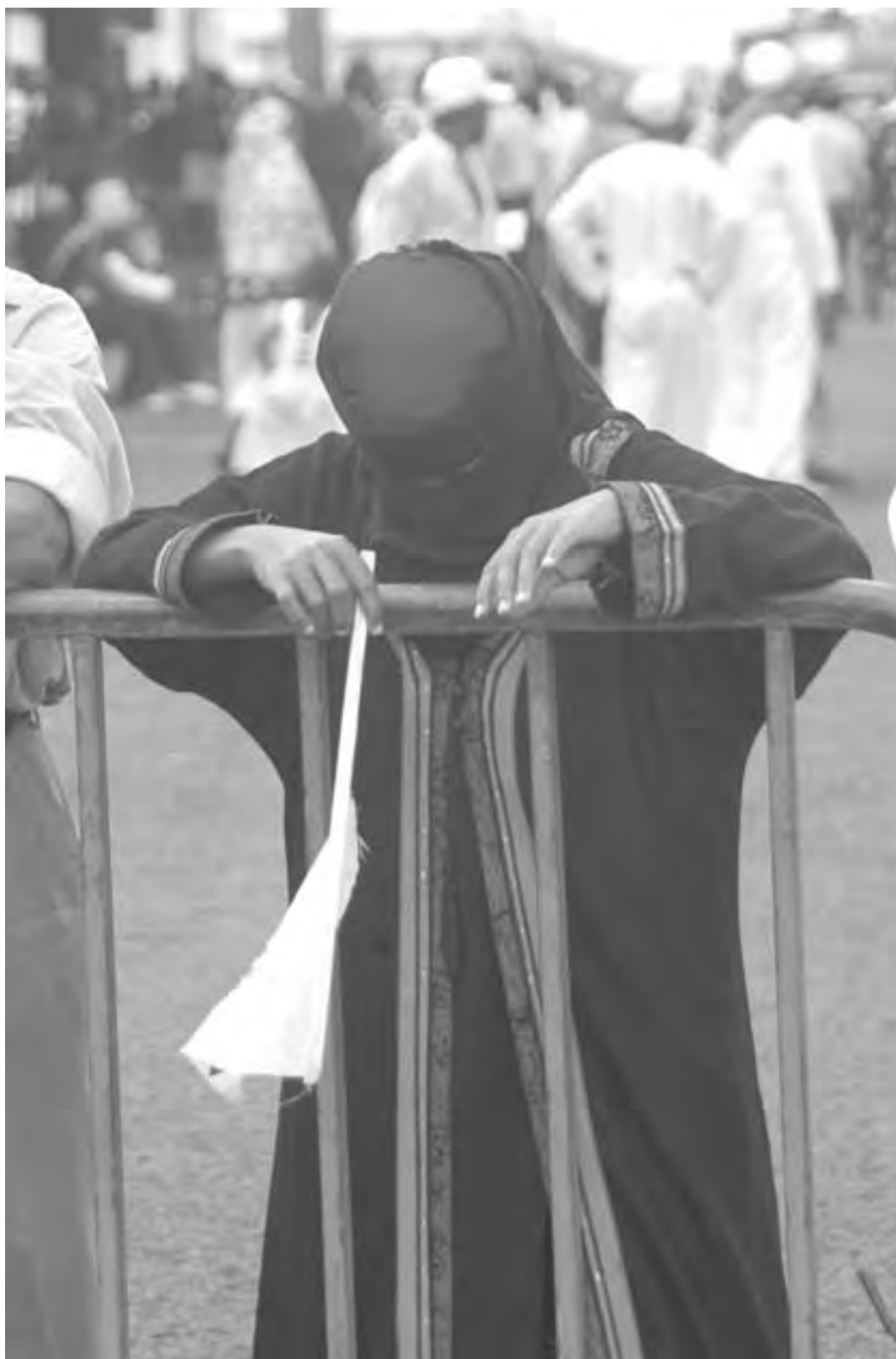
Ci-dessus, une partisane de Sambi, en 2006, lors de son arrivée à Ngazidja après les primaires.

Muni d'un bon carnet d'adresse, il savait qu'il pouvait miser sur son réseau d'amis arabes, qui ne lui refusent rien, pour bâtir sa politique. En visite en Arabie Saoudite au début de son règne, il est rentré avec un chèque de 2,5 milliards fc (5 millions d'euros) qui lui a permis de démarrer son projet phare sur l'habitat. Un don accompagné de l'envoi de "formateurs pour la fabrication des briques en terre cuite, de moules et de