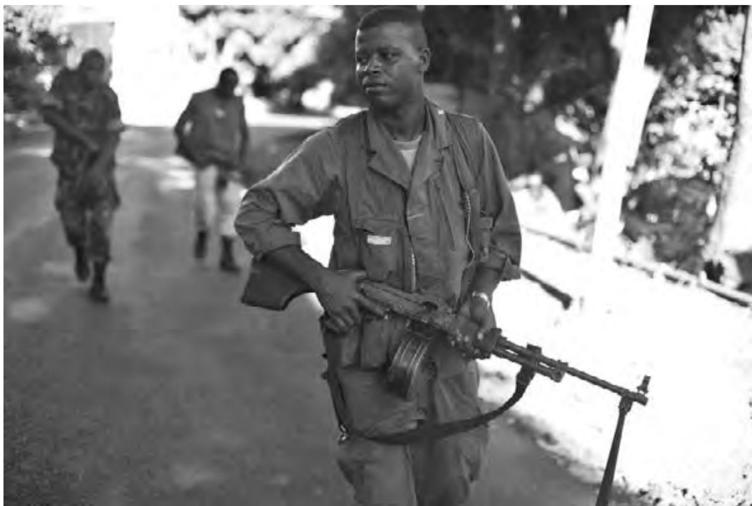
Un membre des Forces de gendarmerie anjouanaises (FGA), avant la chute du régime Bacar, en mars.

Le pouvoir central de l'Union des Comores a dépouillé la police avant de la transférer aux exécutifs insulaires, qui gèrent l'héritage selon les desiderata de chacun... Enquête sur une négligence périlleuse.