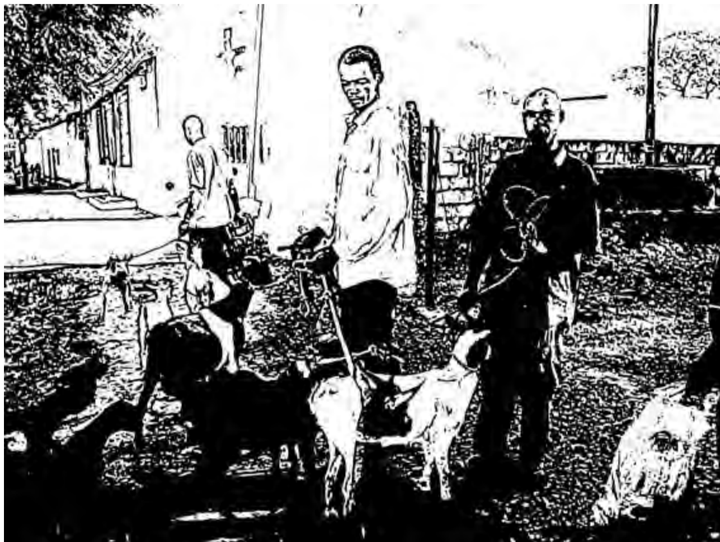
Ci-dessus, des détenus mohéliens lors d'une de leur "virée" dans la capitale.