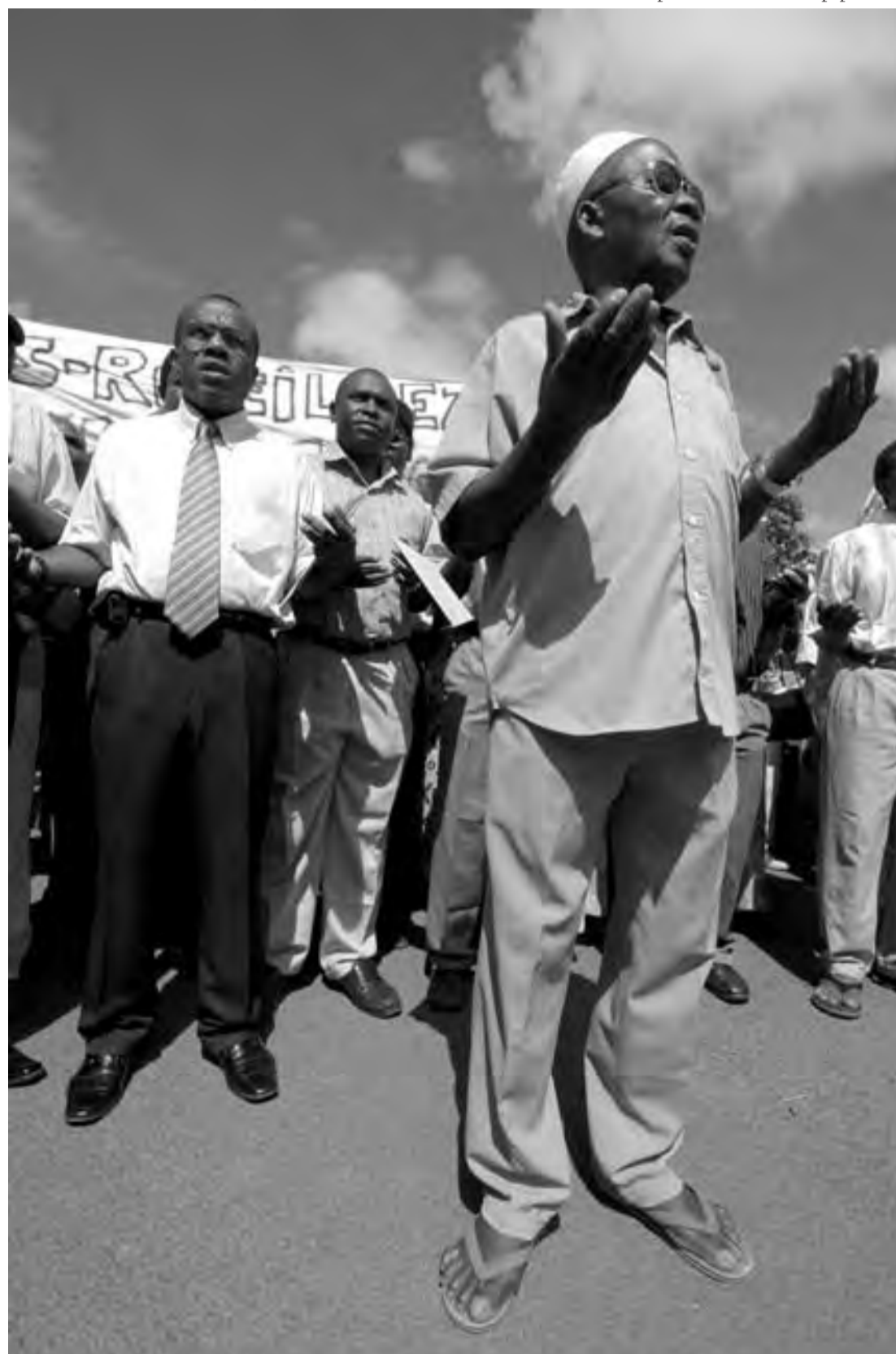
Dimanche 6 avril à Mamoudzou, lors de la manifestation en réaction au 27-Mars. Une prière contre les sans-papiers...

d'un excellent a priori en ce qui concerne leur débrouillardise, leur ardeur au travail, et leur peu d'exigences salariales" 3 , à tel point que les grandes entreprises de l'île - Colas, Sogea, Snie...- sont accusées de les préférer systématiquement aux natifs de Maore. La solution envisagée consiste à développer la formation professionnelle pour que les jeunes locaux atteignent un niveau supérieur à celui de leurs voisins. Mais la hantise de voir les Comoriens rester concurrentiels en acceptant d'être sous-payés demeure. "Le pourcentage sans cesse croissant d'une main d'œuvre peu exigeante dès qu'il s'agit de gagner un salaire supé-