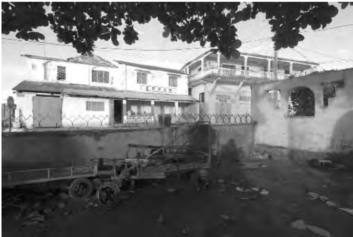
Devant le port de Mutsamudu. Aux premières loges, le bâtiment de droite accueille les bureaux d'ASC.