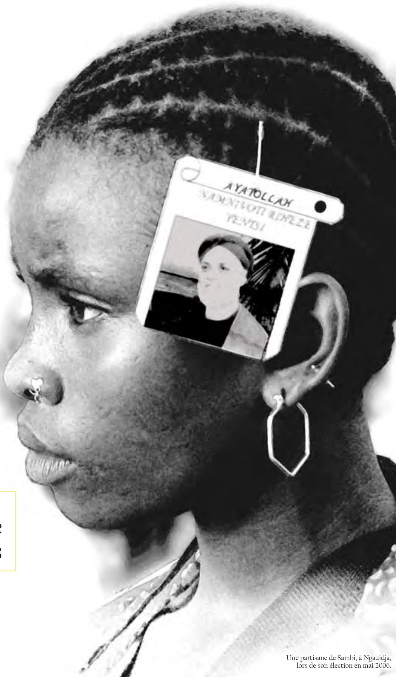
Une partisane de Sambi, à Ngazidja, lors de son élection en mai 2006.